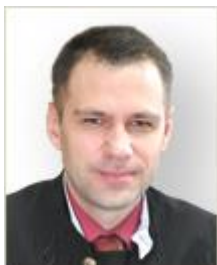
Андрей Терёшин, судья Десятого арбитражного апелляционного суда